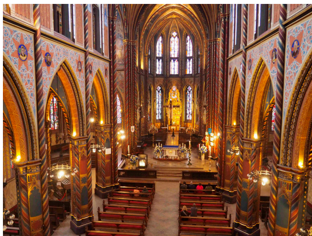
Marienbasilika in Kevelaer