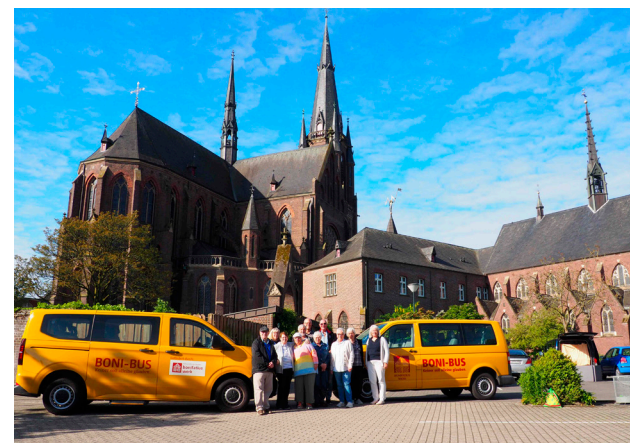
Pilgergruppe aus der Pfarrei St. Christophorus

Glaube bestärkt. Glaube verbindet. Glaube gibt Orientierung.