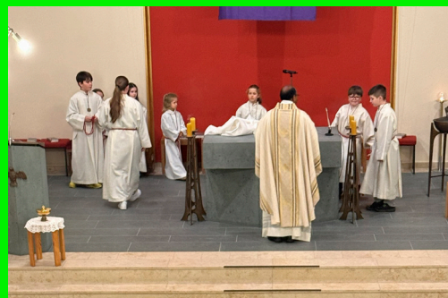
Gründonnerstag Entblößung des Altars