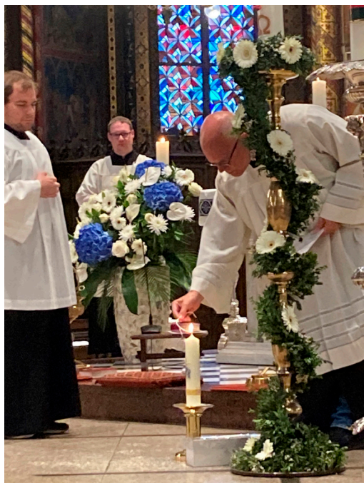
Weihe der Kerze aus Kevelaer für die Pfarrei