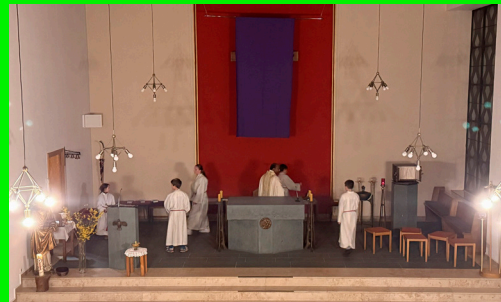
Gründonnerstag Entblößung des Altars